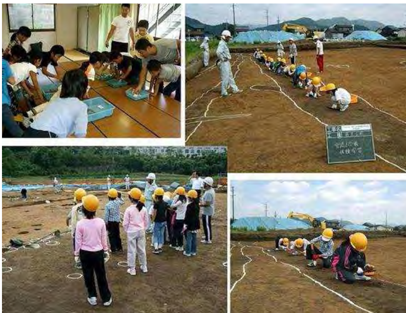
発掘を体験する宮崎小児童

9月22日に岡崎市立宮崎小学校の3・4年生児童15名が西牧野遺跡を見学しました。自分たちの住んでいる地域の遺跡ということもあり、本遺跡で出土した縄文土器や旧石器などの遺物に目を輝かせている姿が印象的でした。発掘調査現場に入って発掘体験もしました。土器片が出土するとうれしそうに近くの友達に見せていました。この体験が歴史に興味をもつきっかけになればと思います。