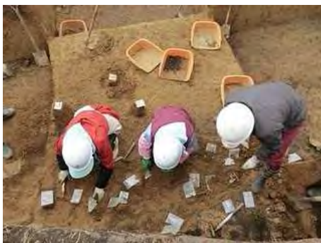
10Db区作業の様子（ビニール袋の中には石器が入っています）