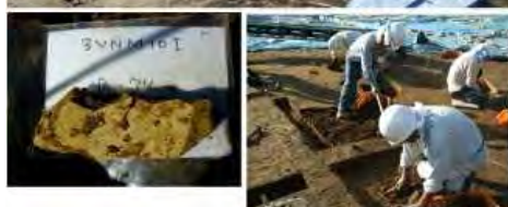
10I区全景（写真上） 旧石器と発掘調査の様子（写真下）