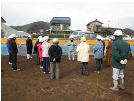
多くの先生方も見学に訪れました