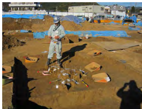
10I区 旧石器出土状況