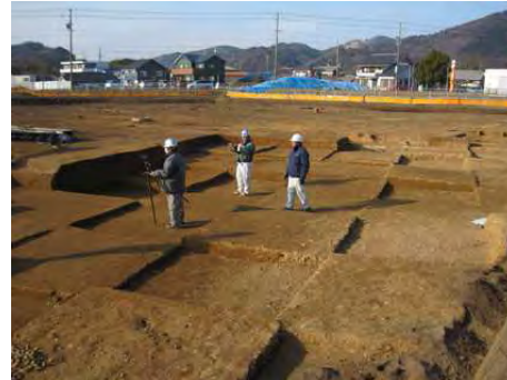
2.5m四方に区切って、旧石器の調査を行いました