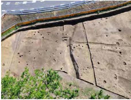
B区調査完了（9月3日撮影）

今後の調査で、旧石器がさらに多数出土することも予想されています。そのときは、本ページで紹介していきたいと思えます。