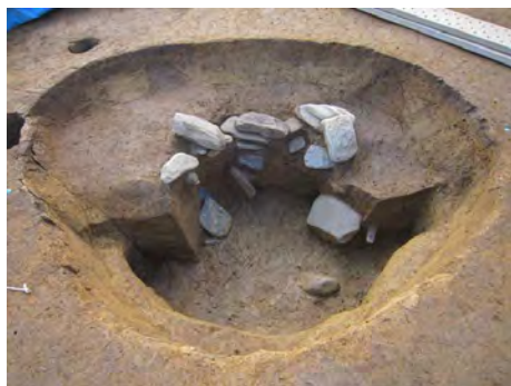
10I区 中世の石組み井戸