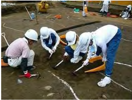
中学生の職場体験学習の様子

この経験をもとに、地域の歴史への関心を高めてほしいと思います。また、将来の職業選択の一つの候補として夢を広げてもらえたらうれしく思います。