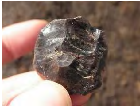
黒曜石製の石器（10Db区出土）