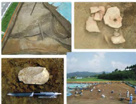
発掘現場の様子（左上・右下）と出土遺物（右上・左下）

西牧野遺跡での発掘調査は順調に進んでいます。現在は調査区の西側のエリアを中心に行っています。石器や土器片など遺物も出土し始めています。毎日暑い中での作業ですが、体調に気をつけ、作業員さんたちと協力しながら、和やかな雰囲気ですべてを進めています。