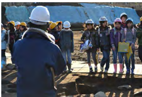
熱心に説明に聞き入る小学生のみなさん

調査は、下層での旧石器確認作業と最後に残った調査区の遺構掘削に入ったところです。