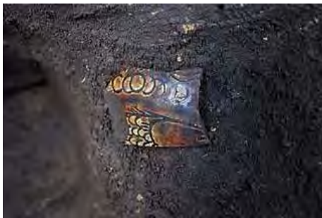
魚波文付四耳壺片が出土