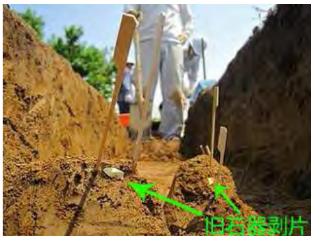
旧石器剥片 (西牧野遺跡B区より出土)

調査が始まっておよそ1ヶ月が経過しています。現在のところ、遺物としては旧石器の剥片が数点と縄文後期から晩期にかけてのものと思われる土器片などが出土しています。