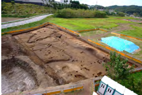
C区全景写真(10月12日撮影)

10月12日にC区の空撮が行われました。C区の調査の成果としては、縄文時代晩期～弥生時代中期の遺物を含む大規模な流路、中世の遺構や遺物などが見つかったことなどです。他の調査区との関連も含めて検討していきたいと思います。