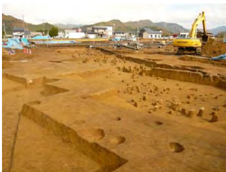
10G区旧石器出土状況