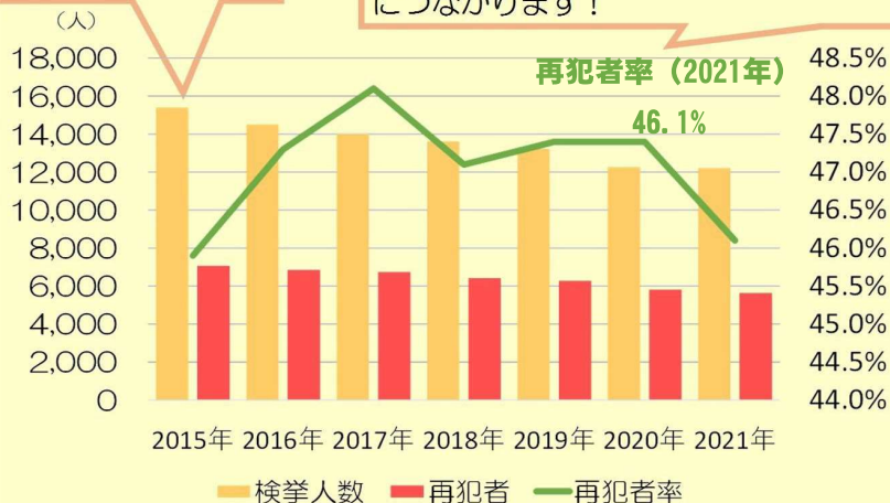
愛知県内の刑法犯検挙人員・再犯者率の推移

刑法犯により検挙された人のうち、約半数が再犯者であり、再犯を防止することが「安全に安心して暮らせる愛知」につながります！