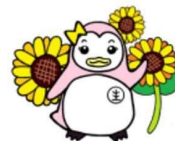
更生ペンギンのサラちゃん