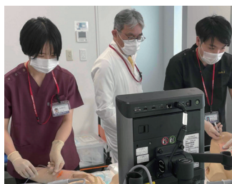
【CVC挿入シミュレーション研修】

藤田学園建学の精神「独創一理」に基づいた良い臨床医(病者に共感する心を持ち、ほかの医療者と協調して最良の医療を行い、かつ後継者の育成に積極的な医師)を育てることを目的としています。地域医療の拠点病院として救急医療と癌治療を行っています。比較的コンパクトな病院であり、診療科間の垣根も低いのも研修にプラスに働くことと思います。救急では1次から2次の救急医療を外来から入院まで、癌診療は診断から治療を包括的に学びかつ研修することが出来ます。救急と癌治療を顔の見える環境で貴重な医師の一員として学べるのが最大の特徴です。