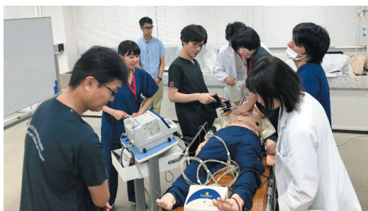
研修医向けのセミナーも多数開催しています!

総合研修センターは、皆様のスムーズな研修をサポートいたします。プログラムは、大学病院2年間研修以外に、たすき掛け研修、名古屋市立大学病院の特徴でもある産科婦人科専門研修・小児科研修があります。連携病院での短期研修も可能であり、自分に合った自由度の高い研修プログラムを組むことが可能です。