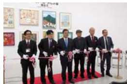
あいちアール・ブリュット展開会式 (名古屋市民ギャラリー矢田)