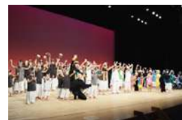
プロデュース舞台「親指王子」 (名古屋青少年文化センター)