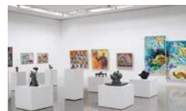
あいちアール・ブリュット美術館 (名古屋市民ギャラリー矢田)