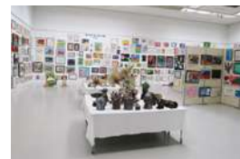
公募作品 (名古屋市民ギャラリー矢田)