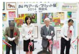
開会式 (名古屋市民ギャラリー矢田)