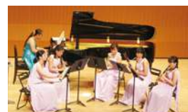
愛知県立芸術大学フレッシュアーティストによる 木管五重奏とピアノの夕べ (名古屋東文化小劇場)

舞台・ステージ発表において、愛知県立芸術大学との共催事業として、誰でも気軽にクラシックを楽しめるコンサートを初開催。