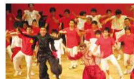
LOVE & PEACE 2017 (愛 Wish プロジェクト) (名古屋東文化小劇場)

第16回全国障害者芸術・文化祭あいち大会」の成果を継承し、舞台・ステージ発表を充実させ、「あいちアール・ブリュット障害者アーツ展」として拡大開催。