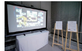
「とんでもない」[愛 Wish プロジェクト] (名古屋市民ギャラリー矢田)

新型コロナウイルス感染拡大防止のため、舞台・ステージ発表を映像作品として「あいちアール・ブリュット展」の中で放映。