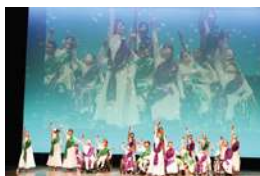
開会式アトラクション (愛知芸術文化センター 愛知県芸術劇場)