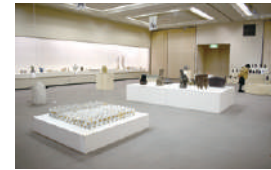
あいちアール・ブリュット・サテライト展マテリアル～土の声にふれる～ (愛知県陶磁美術館)

陶芸作品を中心に障害のある方の自立を目指した創作活動などを紹介する、「あいちアール・ブリュット・サテライト展マテリアル～土の声にふれる～」を開催。