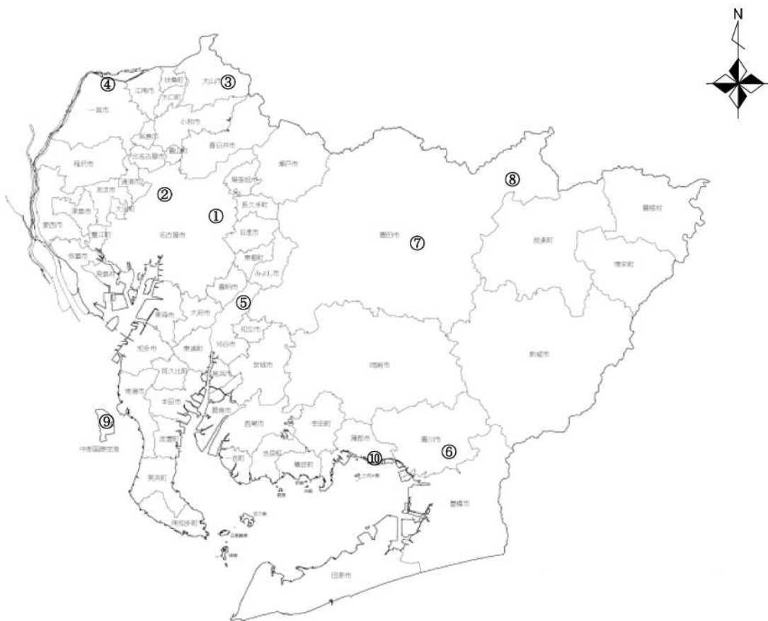
図-2 調査地分布図（数字は調査地ID-表-1参照-）