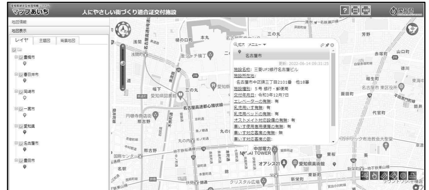
図 3：マップあいち「人にやさしい街づくり適合証交付施設」マップ