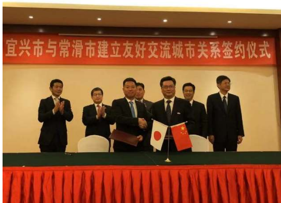
友好交流都市締結式

明治時代に始まったこの技術交流により常滑焼きは発展しましたが、宜興市との交流は長らく途絶えていたようです。近年になり、陶磁器製品の国内需要が落ち込む中、海外での販路開拓を進めていくうちに宜興と常滑の焼き物業界関係者が互いに交流をもつようになりました。その後、中国と日本とを行き来する中国人実業家の仲介により2014年(平成26年)頃から業界レベルでの交流が始まり、2017年には、宜興市長と常滑市長が両市の焼き物業界の交流を支援していくという行政間の合意にまで発展しました。