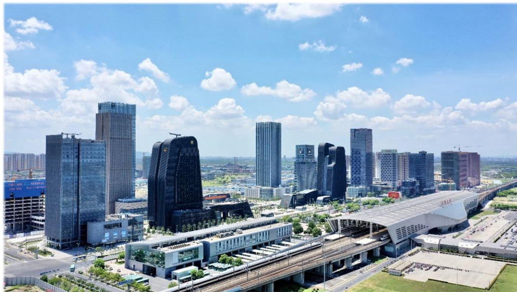
高速鉄道蘇州北駅

インフラの建設も加速し、体系的に各種の交通施設を構築し、中枢サービスコアの全体像も更に強化している。