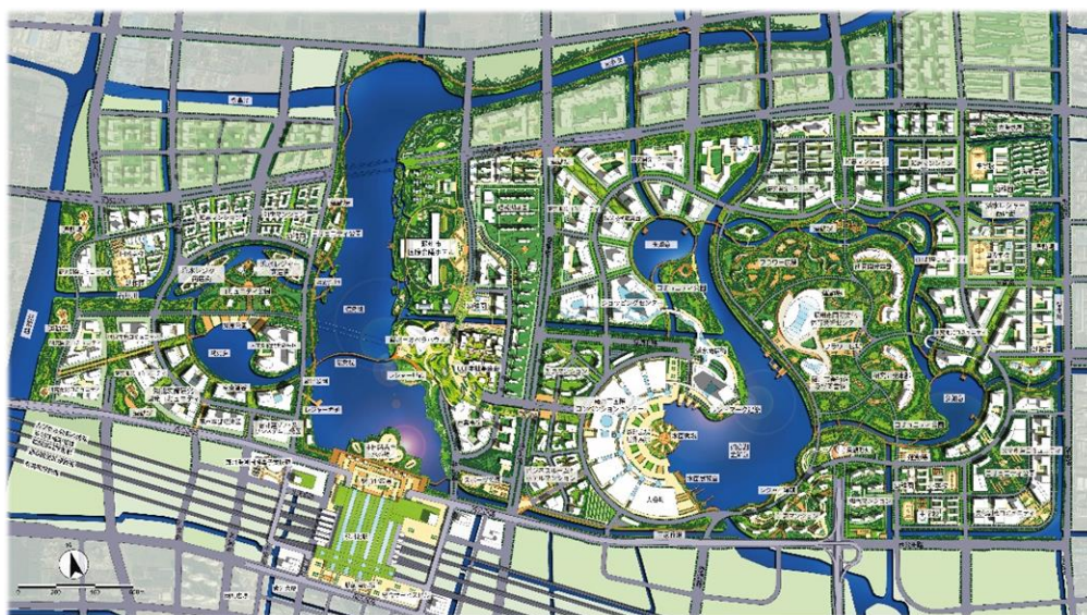
知力支持翼－長江デルタ国際研究開発コミュニティ

10 平方キロ。高標準で長江デルタ国際研究開発コミュニティを建設し、研究開発企業と科学技術人財の集積地を作っている。西翼は技術転換翼であり、蘇相協力区に位置し、面積は約 22 平方キロ。スマート製造業のクラスターを形成している。