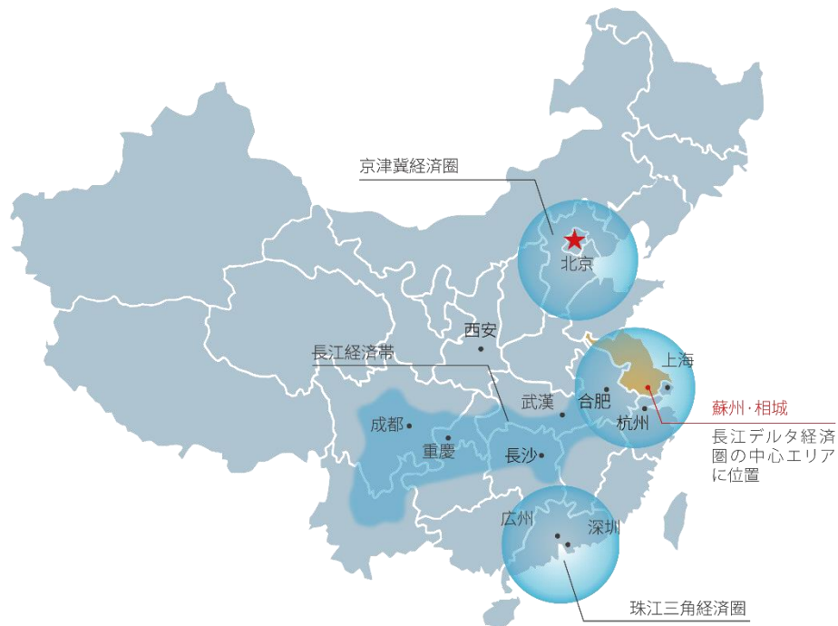
江蘇省蘇州市相城区ポジション図

2020年4月、相城区全域をカバーする中日（蘇州）地方発展協力模範エリアは、国家發展改革委員会弁公庁の承認を認められた。5月14日、国家發展改革委員会地区司は、中日地方発展協力模範エリアの起動会を開催し、国レベルでの日中協力区の建設が正式に始まった。相城区は模範区の建設を全面的に加速し、目標は全国の対日協力プラットフォームの見本である。