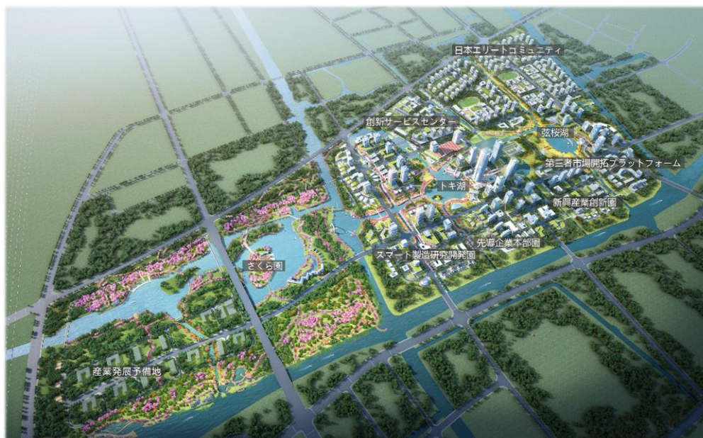
中枢サービスコアのイメージ図

るための回答文書」を公表し、中日（蘇州）地方発展協力模範エリアは、国内で初の6つの模範区の1つであると明記された。