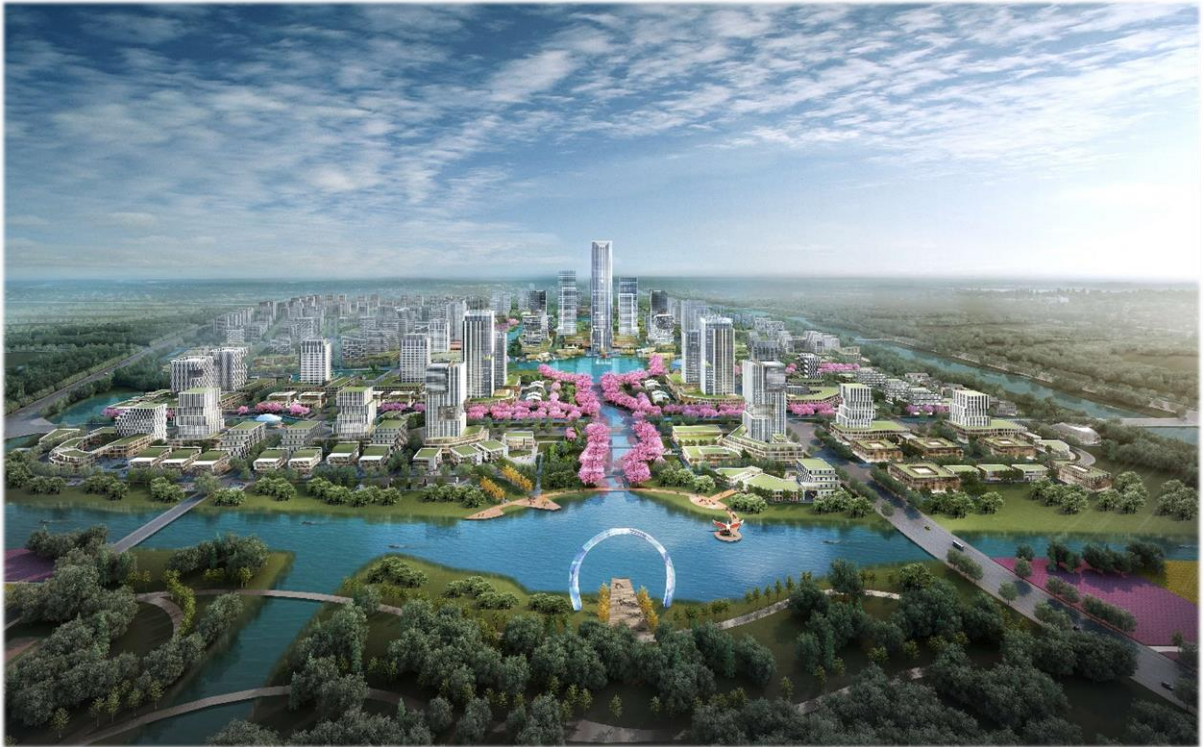
中枢サービスコアのイメージ図

一、コミュニティサービスセンターを建設し、各種の文化施設、日本人学校、日系医療サービスセンター、水辺の緑道、オープンスポーツ場などの公共施設を導入し、日系高級サービスエリアを目指し、今年後半から着工する。中枢サービスコアは、淮海街、蘇州日本人学校、イオンモール、イズミヤ百貨店などと共に蘇州の日系インフラを形成している。また、協力模範エリアでは、ノルドアングリア国際学校、中米国際医療健康センターなどの国際的な施設も導入し、日系企業と高級人材に良い環境を作り出す。中日書道篆刻展など対日文化活動も積極的に行い、愛知県、福岡県、石川県などとの交流も展開し、相城区の友達を増え、協力模範エリアの国際交流チャンネルを開拓している。