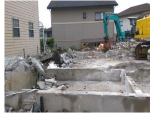
Bina temelinin sökümü