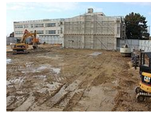
Zemin tesviyesi, temizlik