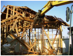
Bina gövdesinin yıkımı