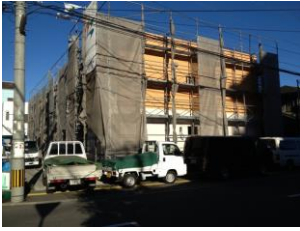
İskele kurulumu, cephe kaplama