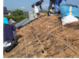
Çatı kaplama malzemesinin sökümü (elle söküm)