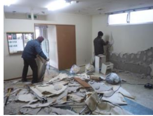
Bina içi yıkımı (elle yıkım)