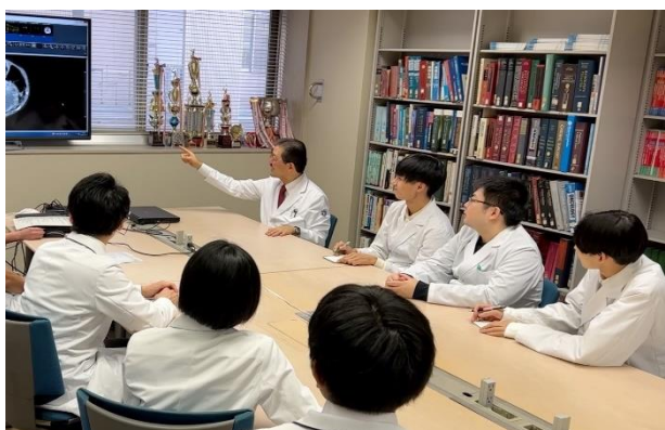
▲新入院患者のカンファレンス風景

1 年目は研修連携施設のうち救急、NICU、高い専門性をもった大規模施設、または小児科のプライマリーな診療を行う中小規模施設において研修を開始する。2 年目は 1 年目に引き続いて、慢性疾患、重症疾患、救急の研修を行うとともに、それぞれの連携施設の特徴に応じて血液・腫瘍、神経、循環器、アレルギー、腎臓、新生児など専門性の高い疾患についても研修を行う。3 年目は研修基幹病院である名古屋大学医学部附属病院における半年の研修を含めた専門性の高い研修を行う。