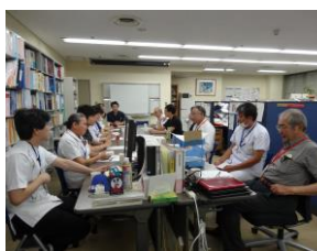
多職種ミーティング