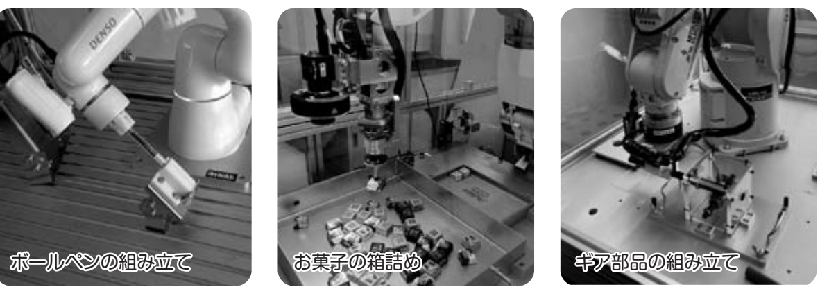
ボールペンの組み立て お菓子の箱詰め ギア部品の組み立て

高校生チームが約7か月間かけて取り組んだ、「産業用ロボットを用いたモノづくりを自動化するシステム」を構築する競技課題を競います。