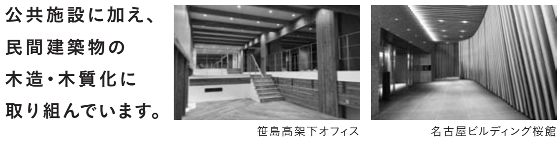
笹島高架下オフィス 名古屋ビルディング校館