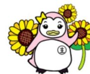
更生ペンギンのサラちゃん