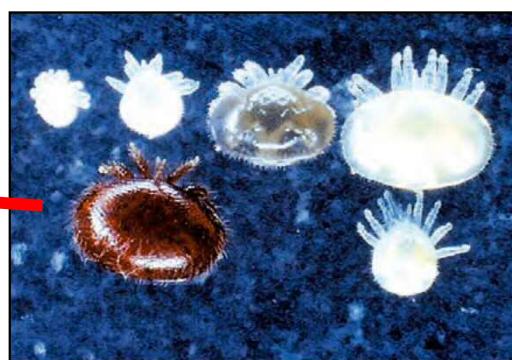
ミツバチヘギイタダニ