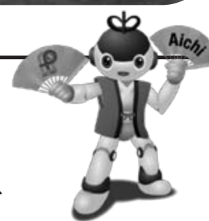
ロボカップアジアパシフィック2021あいち常設キャラクター あいべえ(Ai-beh)

ロボットが自ら考えて動く「自律型ロボット」の国際大会です。ロボカップを代表するサッカーのほか、家庭や工場、災害現場など、様々な場面を想定した競技でロボット同士が競います。 日程：2021年11月25日(金)～29日(日) 会場：愛知県国際展示場(Aichi Sky Expo) (常滑市) ※29日は名古屋市内