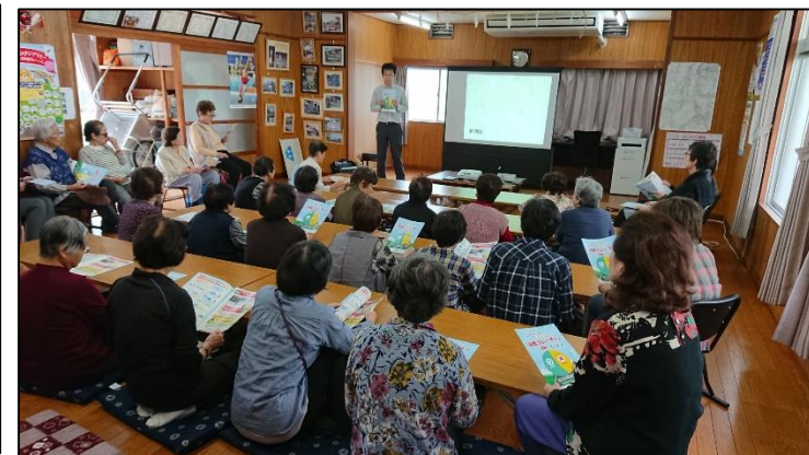
西桜木地区市民館