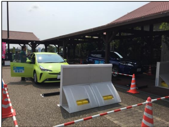
JAあぐりタウン「げんきの郷」