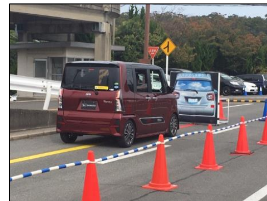
【衝突被害軽減ブレーキ (名古屋ダイハツ(株))】