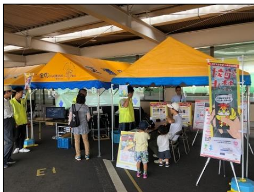
【県民安全課・産業振興課合同ブース】