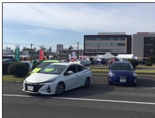
【駐車支援システム (アイシン精機(株))】