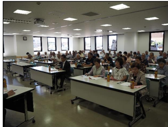
大口町健康文化センター