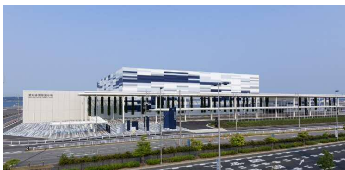
Aichi Sky Expo

愛知県では、製造業を中心とした世界有数の産業集積、国際空港や高規格道路網など充実した交通インフラを有するといった特性を活かし、展示会産業の育成・活性化を通じた内外の多様な交流の促進等を推進することによって、新産業の創出や既存産業の強化などを促進するとともに、国内外からの集客を図り、産業首都愛知の新たな交流・イノベーション拠点