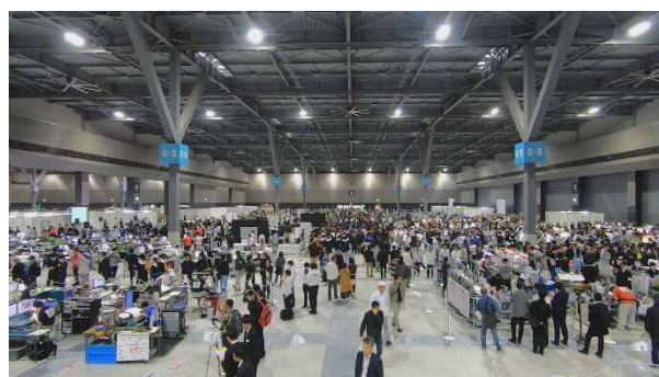
第 57 回技能五輪全国大会