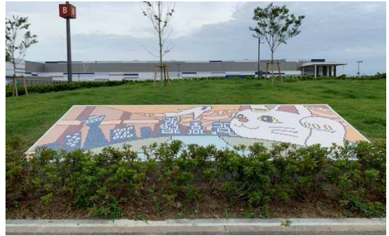
常滑焼タイルアート