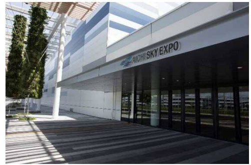
メインエントランス

また、セルフモニタリング業務を総括し、年度管理計画書を始めとした書類の作成、各業務の提出管理等を行っています。