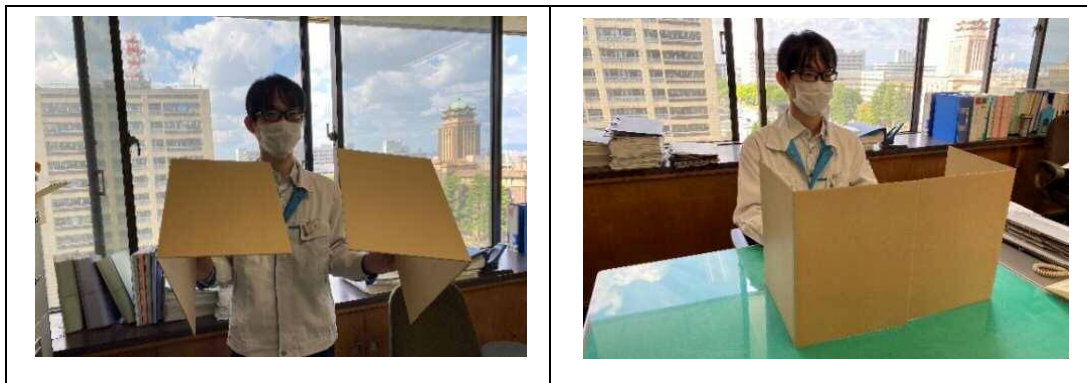
図 飛沫防止ボードの作成例（2つ折りの段ボール2枚を使用した飛沫防止ボード）

エ フェイスシールドや飛沫防止ボード等を活用するなど授業中の飛沫防止対策を講じる。