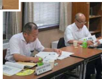
「子ども・若者の育成支援を考える有識者会議」の様子