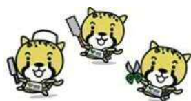
少年少女技能競技大会「アイチータ杯」(平成 29 年 11 月)

また、中小企業の若手社員や工業系学生などにモノづくりの技能を伝えるため、「あいち技能伝承バンク」によるあいち技の伝承士の派遣を行います。