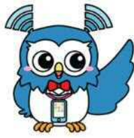
ネットモラル塾のイメージ キャラクター「スマッホー」