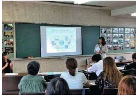
「保護者のためのネットモラル塾」の開催（平成30年6月）