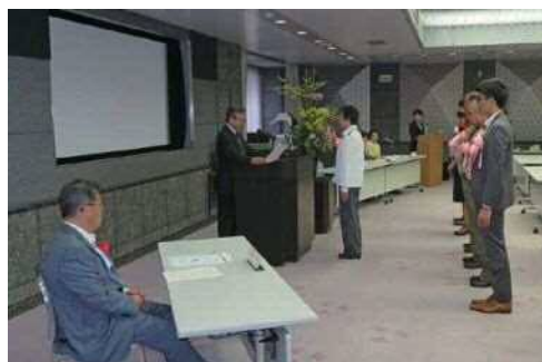
「愛知県青少年育成県民会議青少年団体等表彰式」(平成30年5月)

また、愛知県青少年育成県民会議において、奉仕活動等を長年継続し、活動の成果が特に顕著な青少年及び青少年団体を表彰し、さらなる活動の発展を促進します。