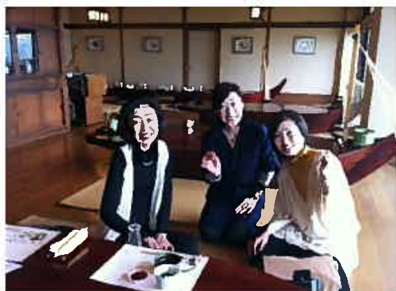
↑ 日間賀観光ホテルにて昼食

今回お母さんは、関東からの友人と一緒に 日間賀島へ遊びに来て日間賀島ランチを楽しんでいました。