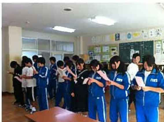
各クラスにて合唱練習☆