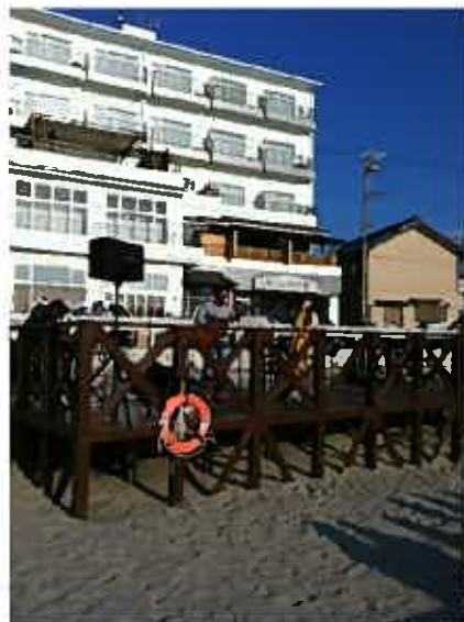
西港サンセットビーチのデッキでのライブ☆