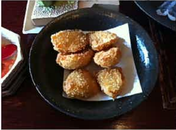
☆常滑産ジャンボニンニクのフライ | 3人前