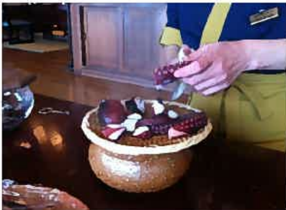
☆たこの丸茹 | 3人前