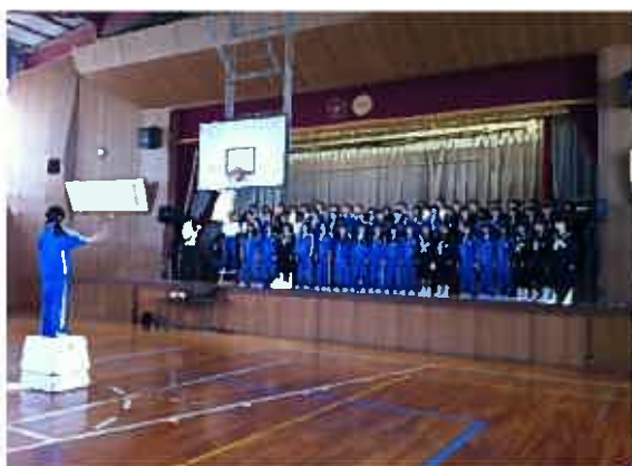
「島人ぬ宝」も1度みんなで合わせて連絡しました。