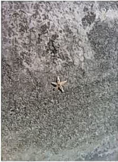
今日も海がきれいだなあ☆