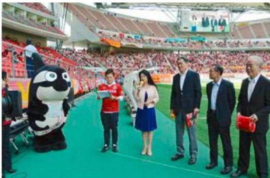
名古屋グランパスの試合前に PR