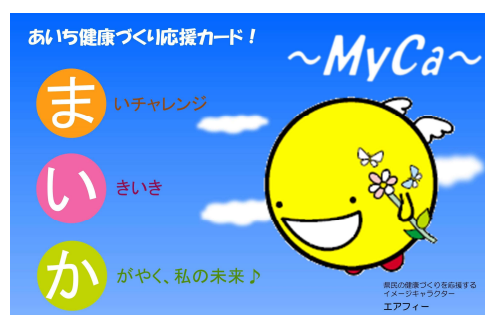
あいち健康づくり応援カード！ ~MyCa~ (まいか)