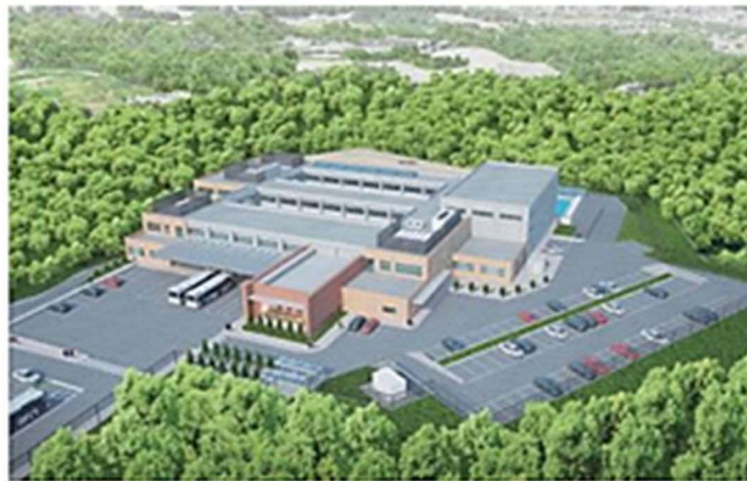
瀬戸つばき特別支援学校（イメージ）