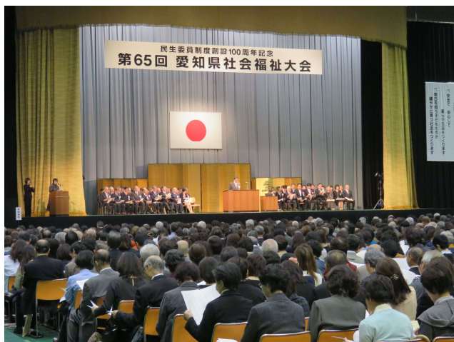
← 第 65 回愛知県社会福祉大会 愛知県体育館にて