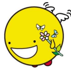
健康づくりイメージキャラクター エアフィー